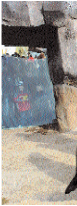
Die Nordsee vor der Haustür: Bremerhaven bietet mit dem Deutschen Auswandererhaus historische Informationen mit Niveau, Segelschiffe aller Größen und die

internationaler Bedeutung. Im Mittelpunkt steht diesmal Paula Modersohn-Becker. Inspiriert und bestätigt durch ihre Eindrücke in Paris, entwickelte sie als erste deutsche Künstlerin eine radikal moderne Bildsprache. Anlässlich des 100. Todestages der Künstlerin lohnt weiterhin ein Besuch in Worpswede, Paula Modersohn-Beckers früherem Wohnort nahe Bremen. Das Künstlerdorf insze-