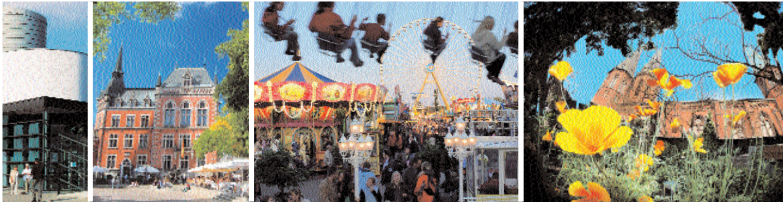
zeigt sich von seiner besten Seite mit dem Horst-Janssen-Museum, einladenden Straßencafés, Volksfesten für Jung & Alt und einer malerischen Altstadt

etwa 1,5 Millionen Besucher den traditionellen Vergnügungsmarkt, der mit einem kilometerlangen Umzug durch die Innenstadt beginnt. Zum Jahresabschluss sorgt der Lambertmarkt für Weihnachtsstimmung. Inmitten der Fußgängerzone verzaubert er in der festlich geschmückten Altstadt und besticht in historischer Kulisse mit über 100 traditionell geschmückten Holzhütten.