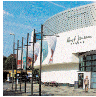
Erste Adresse im hohen Norden: Oldenburg

Dem Künstler Horst Janssen , in Oldenburg aufgewachsen, fühlte sich die Stadt besonders verpflichtet und eröffnete im Jahr 2000 das Horst-Janssen-Museum als weltweit einziges Haus mit einer bedeutenden Sammlung des genialen Zeichners, Grafikers und Autors. Zu den Highlights 2007 zählt eine Sonderausstellung des Malers Jörg Immendorff vom 26. Mai bis 26. August. Der 1945 geborene Jörg Immendorff gehört international zu den bekanntesten deutschen Künstlern. 2006 hat er den Goslarer Kaiserring als Auszeichnung seines künstlerischen Schaffens erhalten. Im Kontext des Horst-Janssen-Museums Oldenburg wird vor allem sein druckgrafisches Schaffen mit rund achtzig Werken im Vordergrund des regionalen und überregionalen Interesses stehen.