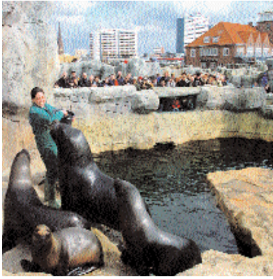
Fütterung der Raubtiere im Zoo am Meer

Event des Jahres 2007 werden soll. Es ist die Geschichte von William Wallace (1267-1305), der vom einfachen Mann zum Volkshelden avancierte und unter dem Namen „Brave Heart“ in die Geschichte Schottlands einging. Die Weltpremiere von „Brave Heart – das Musical“ wird am 18. November 2007 im Musical Theater Bremen sein, die Spieldauer ist zunächst bis zum 5. Januar 2008 geplant.