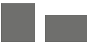
1/8 Seite hoch, quer 79,6 x 92 mm, 100,5 x 64 mm je 1.300,- €