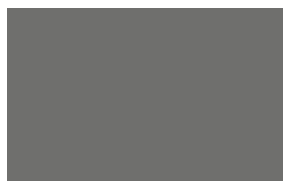
1/2 Seite quer 205 x 128 mm 5.200,- €