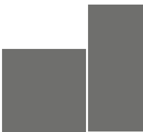
1/4 Seite norm, hoch 121,4 x 120 mm, 79,6 x 184mm je € 2.600,- €