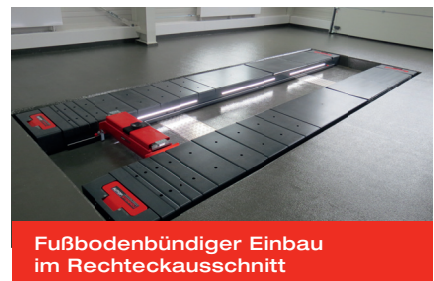
Fußbodenbündiger Einbau im Rechteckausschnitt