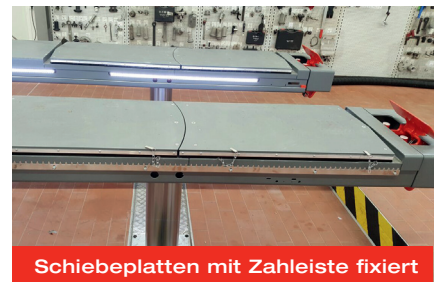
Schiebeplatten mit Zahleiste fixiert