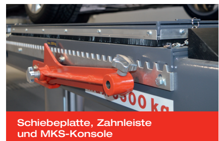
Schiebeplatte, Zahnleiste und MKS-Konsole