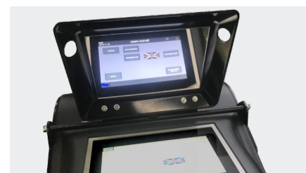
Display Abdeckung mit Spiegel