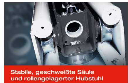
Stabile, geschweißte Säule und rollengelagerter Hubstuhl