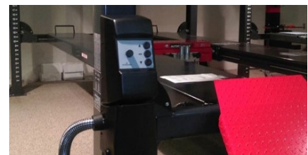
Steuerung und Aggregat an der Säule hinten links