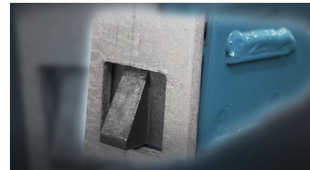
Klinke für Parkposition

D = zweites Hydraulikaggregat für schnellere Hubgeschwindigkeit, Bedienung an der Säule vorne links