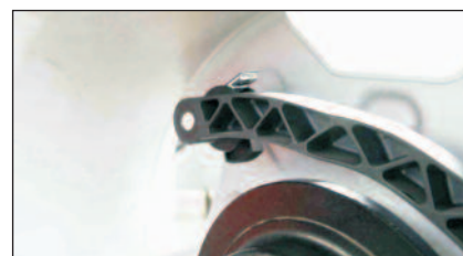
Messarm in Position für das Erfassen der Daten von ALU-Rädern