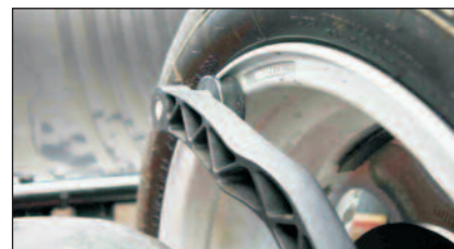
linker Messarm in Position für das Aufnehmen des Abstandes und Durchmessers