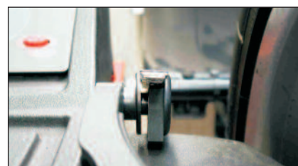
Messarm mit Clip für das Aufnehmen und Befestigen des Gewichtes am Rad