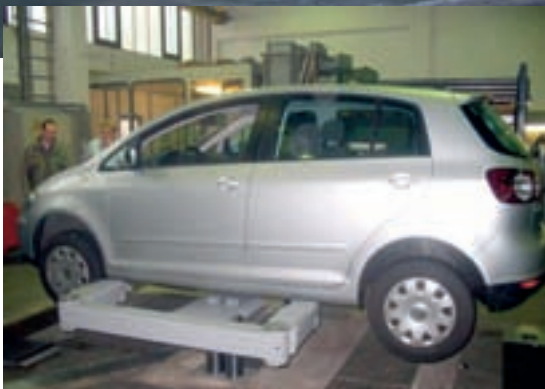
Biglift-Tragarme haben einen großen Verstellbereich