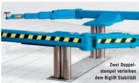
Zwei Doppelstempel verleihen dem Biglift Stabilität

Dank der Stabilität des Biglift schwankt das angehobene Fahrzeug auch nicht. Doch nicht nur Fuhrparks mit Sonderfahrzeugen haben sich bisher für diese