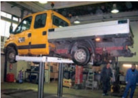
Aufnahme mit dem Biglift bei langem Radstand