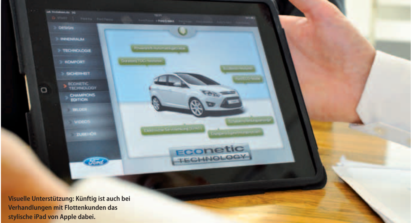
Visuelle Unterstützung: Künftig ist auch bei Verhandlungen mit Flottenkunden das stylische iPad von Apple dabei.