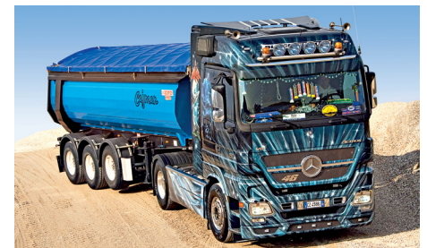
Das ist die Schau: Traumkipper als Mini-Poster