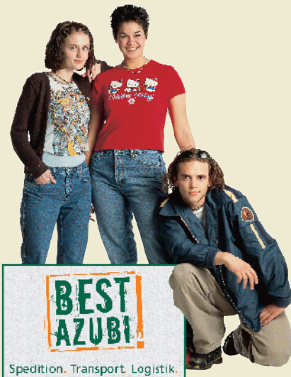
Logo: Suit Group

Profundes Wissen ist gefragt, wenn sich die VR und die Schunck Group auf die Suche nach Deutschlands bestem Logistik-Azubi machen