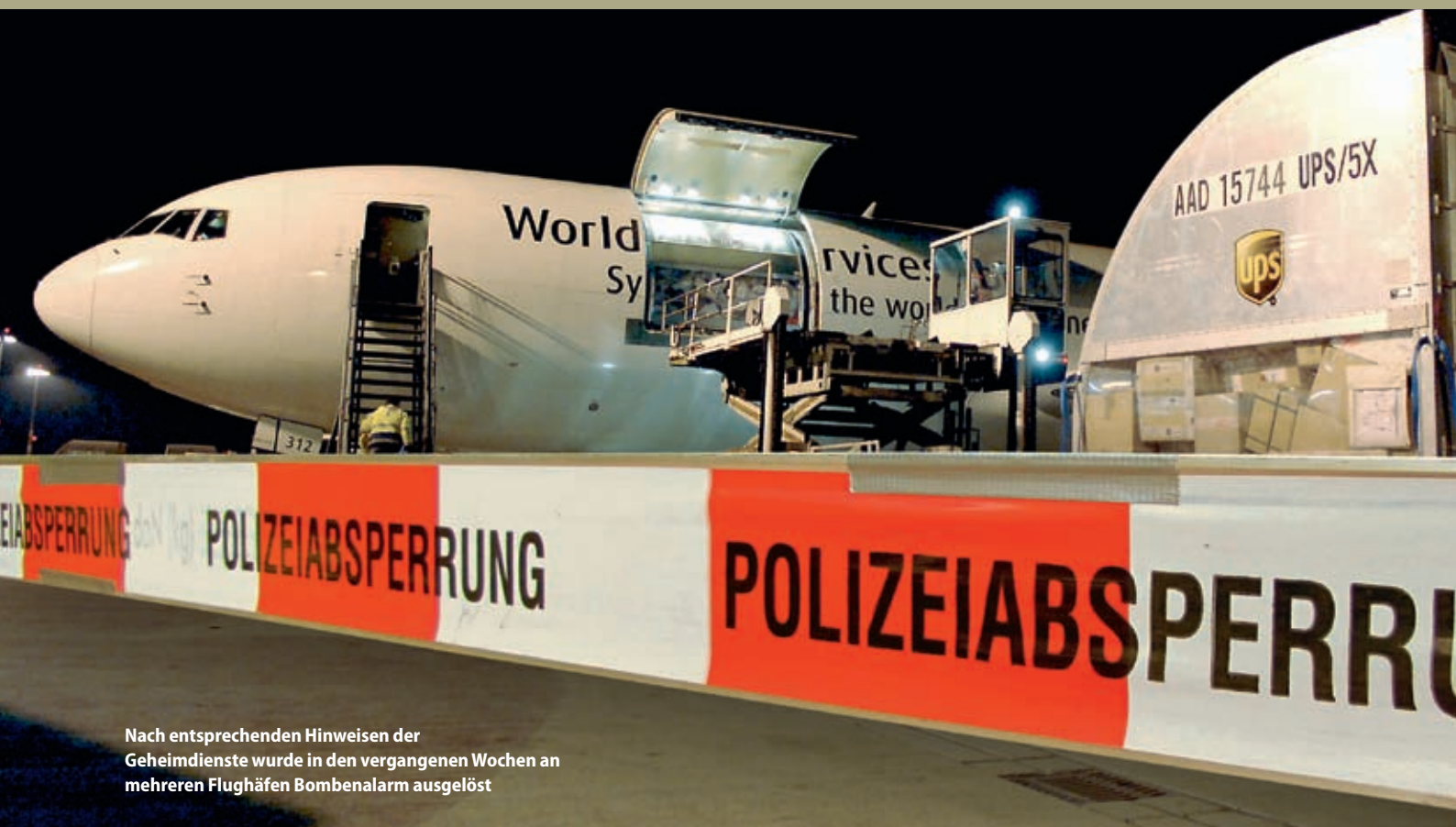
Nach entsprechenden Hinweisen der Geheimdienste wurde in den vergangenen Wochen an mehreren Flughäfen Bombenalarm ausgelöst

lungen zur Verbesserung der Luftfrachtkontrolle. Ein Fünf-Punkte-Katalog, den Bundesinnenminister Thomas de Maizière seinen EU-Kollegen am Montag in Brüssel vorgelegt hat, sieht u. a. eine bessere Kontrolle von Luftfracht aus unsicheren Drittstaaten vor sowie ein Raster, mit dessen Hilfe verdächtige Sendungen anhand von Frachtlisten gefiltert werden können. Des Weiteren denkt der CDU-Politiker an schwarze Listen für Flughäfen, die nicht nach westlichen Standards kontrollieren. Der Minister hat zudem die Logistikunternehmen aufgefordert, Kunden die exakte Nachverfolgung ihrer Fracht zu verwehren. „Bisher waren alle davon ausgegangen, dass Frachtgut für Attentatsversuche nicht so gefährdet ist, weil Terroristen nicht wissen konnten, in welchem Flugzeug und auf