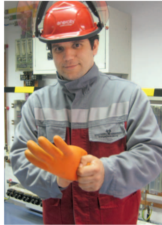
Dichtheitsprüfung von Schutzhandschuhen vor Arbeitsbeginn

Aber was bedeuten die DIN EN Nummern? Ist Hilfe bei der Auswahl von PSA erforderlich? Informationen und Hilfestellungen bieten die Berufsgenossenschaftlichen Regeln (BGR) über PSA (siehe Kasten rechts oben).