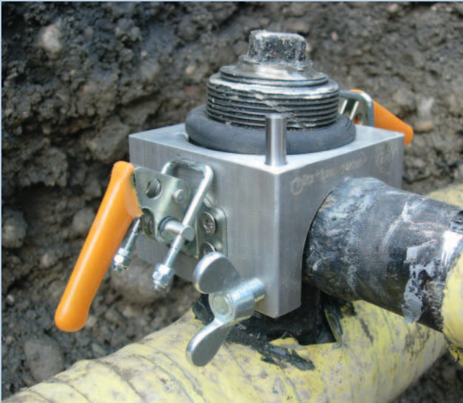
Das Abdichtungsblock-Unterteil mit Dichtung wird über dem T-Stück montiert und festgeklemt.