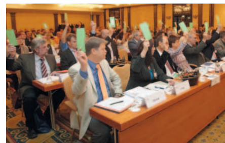
Die erste Vertreterversammlung der BG Energie Textil Elektro wählt ihre Vorsitzenden