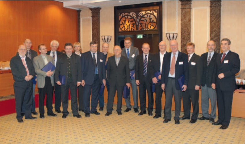
Ausscheidende Mitglieder der Selbstverwaltung der BGFW mit Vorsitzenden und Hauptgeschäftsführer