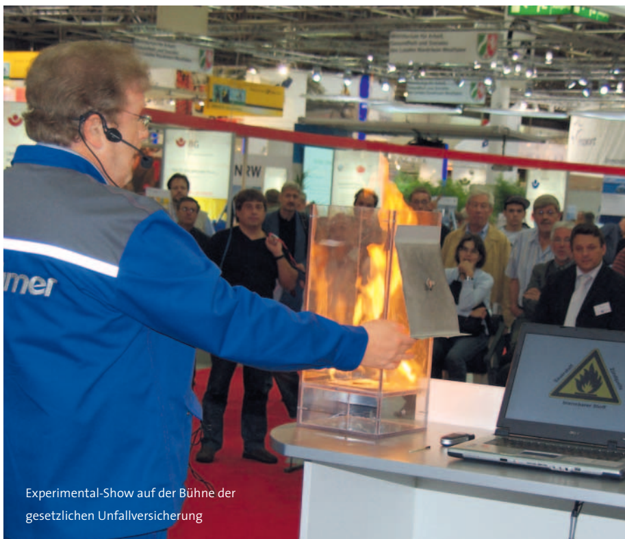
Experimental-Show auf der Bühne der gesetzlichen Unfallversicherung