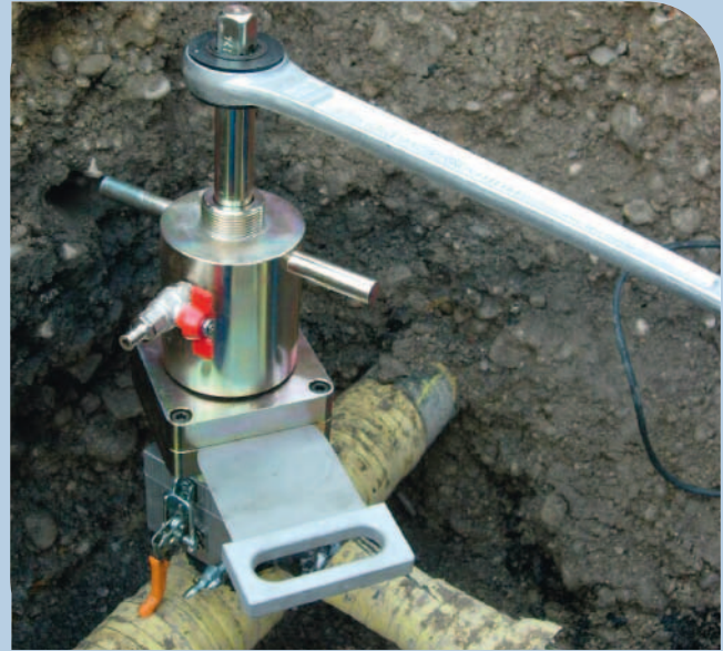
Abdichtungsblock und Blechschieberblock.