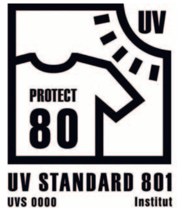
Label für UV Schutzbekleidung

Wer sich mit Kleidung schützen will, muss wissen: T-Shirt ist nicht gleich T-Shirt. Jedenfalls, wenn es um UV-Schutz geht. Kunstfasern wie Nylon und Polyamid schützen weniger als Baumwolle, nasses Gewebe weniger als trockenes. Genaue Auskunft über den UV-Schutz eines Kleidungsstückes gibt das Prüf- und Zertifizierungssiegel UV-Standard 801. Dabei wird getestet, wie viel UV-Strahlung der Stoff auf die Haut des Trägers durchlässt und das Textil – ähnlich wie bei Sonnencremes – einem Schutzfaktor zugeordnet. Dieser besagt, um wie viel län-