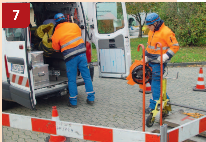
Bild 7: Bei allen Tätigkeiten, bei denen der Kopf nur durch Anstoßen an harte, feststehende Gegenstände verletzt werden kann, sind Industrie-Anstoßkappen (DIN EN 812) eine Möglichkeit, sich vor Kopfverletzungen zu schützen. Ein Einsatzort wäre z. B. ein Schacht in der Fernwärmeversorgung.

Bild 6: Ein Absturz kann bei bestimmungsgemäßer Benutzung der Steigschutzeinrichtung vermieden werden.