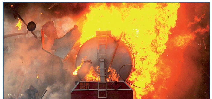
LAGER / WAREHOUSE

Please find herein a comprehensive overview under the form of a table of contact persons in admission offices in Germany and abroad.