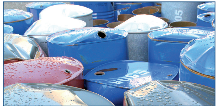
VERPACKUNG / PACKAGING