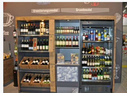
Drei Klimazonen in einem: Das Weinmodul bietet einen nichtgekühlten, einen gekühlten und einen tiefgekühlten Bereich.

In der richtigen Auswahl und in ansprechenden Möbeln kann auch Wein an Tankstellen erfolgreich sein, ist man bei Edeka Food Service überzeugt. Deshalb hat das Unternehmen ein Modulregal für Wein, Sekt und Spirituosen mit verschiedenen Erweiterungsmöglichkeiten und Zubehör konzipiert. Wichtig bei der Auswahl war den Entwicklern, dass den Tankstellenkunden nicht die gleichen Produkte angeboten werden wie im Einzelhandel. Vielmehr handelt es sich um hochwertige Gastronomieweine.