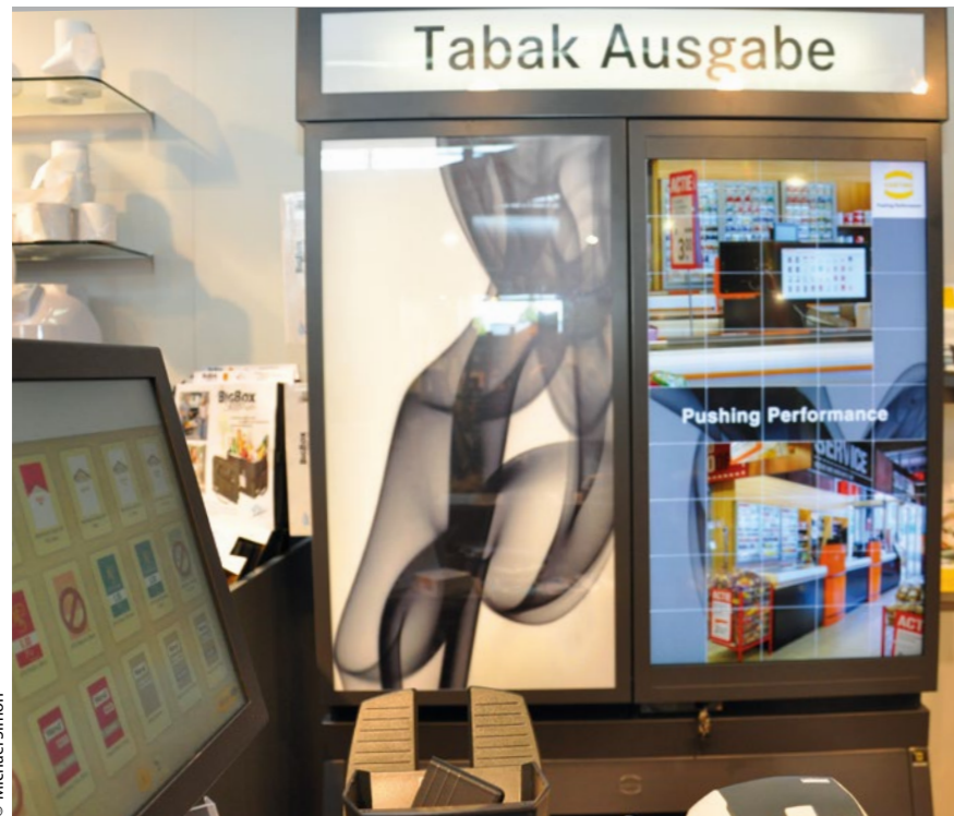
Mit dem Touchscreen (l.) wählt der Mitarbeiter die Zigaretten aus, die der Automat dann auswirft.

Tabakwarendiebstahl durch Mitarbeiter ist für viele Tankstellenbetreiber ein leidiges Problem. Abhilfe könnte ein Automat schaffen, der Betrüger schneller entlarvt. Und er hat noch weitere Vorteile gegenüber dem Regal.