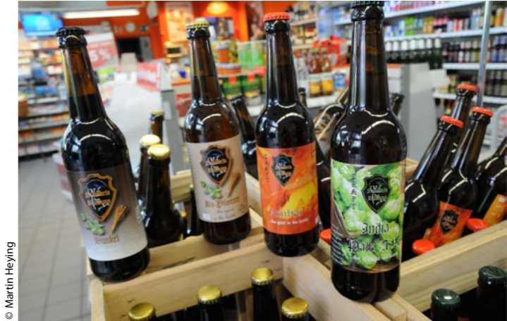
Das Craft-Bier der Brauerei Schinkel gibt es außerhalb der Brauerei nur hier zu kaufen.