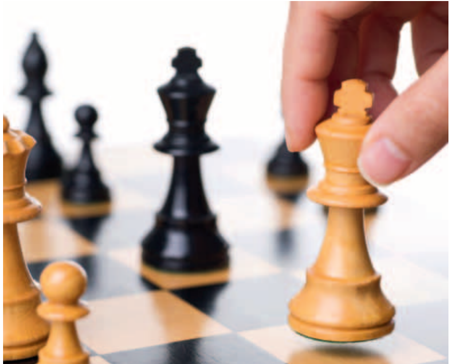
„Zug für Zug zum Erfolg“ – so das Motto von Logistik Masters 2012.

Wer bei Logistik Masters erfolgreich abschneiden will, muss über einen Zeitraum von sieben Monaten Fragen aus allen Be-