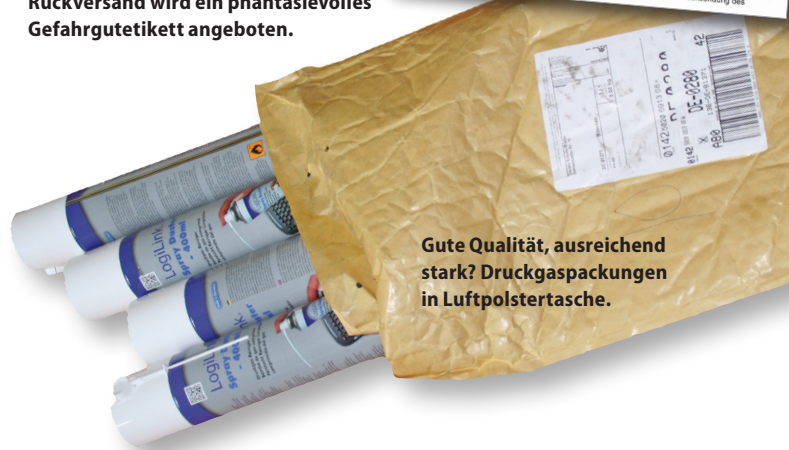
Gute Qualität, ausreichend stark? Druckgaspackungen in Luftpolstertasche.

der Berliner Händler, sondern Mitarbeiter vom „DHL Home Delivery Service“ in der Nähe des Empfängers. Fast scheint es so, als wenn die Verantwortlichkeiten aus dem Gefahrgutrecht, vom Absender über den Verpacker, dem Fahrer und dem Empfänger, hier neu zugeordnet werden müssten. Ähnlich übernimmt die Handelsplattform Amazon häufig die Absender- und Verpackerfunktion für einen Händler. Noch ein Randerscheinung, wird dem Distanzhandel für Lebensmittel langfristig eine positive Prognose gestellt. Wie sieht es dann mit dem möglichen Rückversand aus? Auf die Originalverpackung kann man zumindest nicht verweisen, der Fahrer nimmt die Transportbox wieder mit.