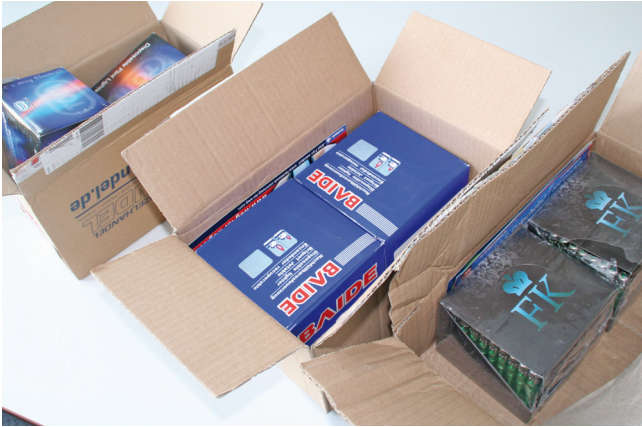
Drei unterschiedliche Anbieter, gleiches Ergebnis. Je 100 Reibradferne wurden ungekennzeichnet, teilweise ungepolstert, verschickt.

setzt werden kann, dass Händler, Kunden und Logistikpartner gemeinsam für klare und regelungskonforme Versendungen sorgen, setzt der Gesetzgeber das nötige Wissen bei Privatkunden nicht voraus und wendet sich bei Vorfällen an den gewerblichen Auftraggeber. Der Unterschied ist in den Abwicklungsvorgängen der Handelshäuser noch nicht angekommen. Es herrscht deutlich Anpassungsbedarf. „Das rasante Wachstum der letzten Jahre hat dazu geführt, dass inzwischen knapp die Hälfte des Paketaufkommens aus dem B2C-Geschäft stammt. Das B2B-Geschäft hat mit rund 40 Prozent einen signifikant niedrigeren Anteil“, bilanziert eine Kurzstudie über den KEP-Markt im Auftrag des Bundesverband der Kurier-Express-Postdienste (BdKEP) für das Jahr 2013. Dem gilt es Rechnung zu tragen.