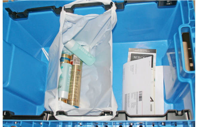
Ein Standardprinzip, das für alle Produkte gleich funktionieren soll: sie werden unterschiedslos in Plastiktüten gelegt und diese eingehängt.

sie meldete, dass tatsächlich nichts weiter zu beachten sei beim Rückversand, sofern die Originalverpackung verwendet würde. Überrascht hat uns ein Händler mit 60.000 Produkten im Portfolio, bei dem wir versehentlich statt einem gleich 12 Liter Waschbenzin bestellt hatten. Nicht nur, dass dieser Händler den Unterschied zwischen Umverpackung und Außenverpackung kannte und stabil, gut gepolstert und kennzeichenreich verpackt hatte. Die Retoureabteilung schickte uns für die Rücksendung unaufgefordert ein aktuelles Sicherheitsdatenblatt, verwies auf die unbedingte Verwendung des Originalkartons und empfahl