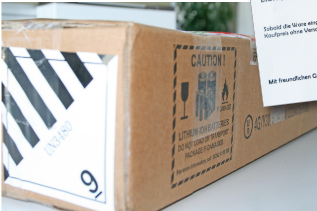
Der Händler hat mit dem Versand einer Lithium-Ionen-Batterie alles richtig gemacht: UN-zugelassene, auf die Batterie zugeschnittene...