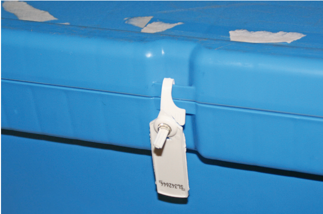
Nagellackentferner und Haarspray vom Online-Lebensmittelhändler: die angelieferte Transportbox wird beim Empfänger „entsiegelt“.