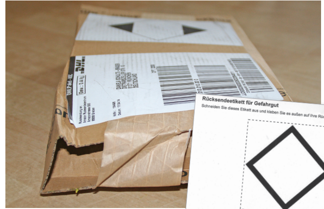
Ein „Klassiker“ beim Versand von Flüssigkeiten: Nagellackentferner in Flaschen mit Weithalsöffnungen und normalen Schraubverschlüssen, liegend verschickt. Besonders: Für den Rückversand wird ein phantasievolles Gefahrgutetikett angeboten.

Und noch zwei weitere Phänomene sind bei unseren Bestellungen aufgefallen. Wir haben bei einem Onlinelebensmittelhändler acetonhaltigen Nagellackentferner sowie Haarspray bestellt. Die Abwicklung verlief herausragend gut mit schriftlicher Ankündigung der konkreten Lieferzeit, die man gegebenenfalls noch hätte ändern können. Der Lieferservice kam und brachte eine versiegelte Transportbox mit, etikettiert mit der Empfängeradresse und dem Aufdruck „Lebensmittel online liefern lassen“, ohne weitere Kennzeichen. Vor den Augen des Empfängers wird das Siegel entfernt. Nagellackentferner und Haarspray lagen in einer eingehängten Tüte, ohne weiteren Sicherungsmaßnahmen (siehe Abbildungen auf Seite 19). Der Fahrer bestätigte, dass dies die Standardverpackung für alle Produkte des Händlers sei. Gut möglich also, dass bei einer Mischbestellung mit Gemüse, diese einfach dazugepackt wird. Verpackt hat nicht