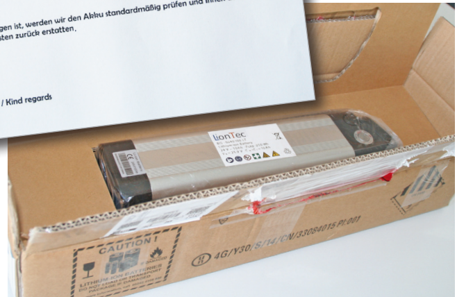
...Verpackung, Kennzeichen, Begleittext für UN 38.3-Test. Das dicke Ende kommt von der Retoureaufteilung zur Frage des Rückversands.

beweist letztendlich, dass unterschiedslos vielen Händlern noch einiges an Verbesserungen in ihrer Abwicklung bevorsteht. Von den 25 Bestellungen haben letztendlich ganze drei mit der Note 1 abgeschnitten, was Verpackung, Kennzeichnung, Dokumentation und Retoure angeht. Über die Hälfte der anderen war sich der Tatsache in keiner Weise bewusst, dass auch eine kleine Versandeinheit mit Gefahrgütern gewissen Anforderungen unterliegt. Oder dass Flüssigkeiten mit Gefahrenpotenzial, die in Flaschen mit gewöhnlichen Schraubverschlüssen verschickt werden, auf alle Fälle aufrecht und gut gepolstert verschickt werden müssen. Diesen Händlern ist nicht klar, was ausgelaufene Flüssigkeit zum Beispiel in einem Frachtzentrum heutzutage zur Folge hat. Da reicht ein Liter mit einer nicht besonders gefährlichen Substanz der Klasse 8, das bei einem unbeabsichtigten Bruch die Frachtteilung für mehrere Stunden geschlossen wird, Mitarbeiter evakuiert und die Feuerwehr alarmiert werden. Hat sich ein Mitarbeiter dann auch nur ein wenig am Finger mit der Flüssigkeit verätzt, wird dem Händler neben dem enormen Folgeschaden auch noch Körperverletzung zur Last gelegt.