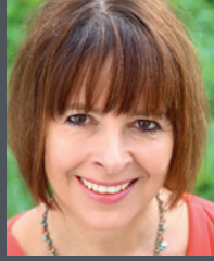
Gudula Schwan, Bundesverkehrsministe- rium (BMVI)