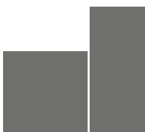
1/4 Seite norm, hoch 121,4 x 120 mm, 79,6 x 184mm je € 2.600,- €