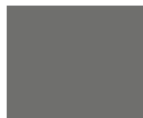
2/3 Seite quer 205 x 168 mm 6.800,- €