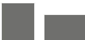
1/8 Seite hoch, quer 79,6 x 92 mm, 100,5 x 64 mm je 1.300,- €