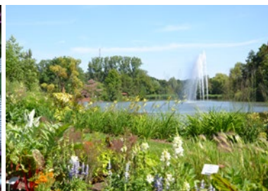
Blütenmeer der Herressener Promenade