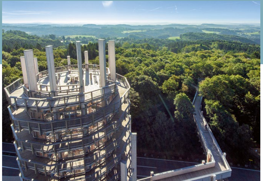
Sehenswert: das beeindruckende Panorama vom 40 Meter hohen Aussichtsturm

das Leben fremder Kulturen vermittelt: Ziel ist es, die Gäste neugierig zu machen. Als Unterrichtsraum in freier Natur eignet sich die Einrichtung des DJH Rheinland rund 50 Kilometer östlich von Köln für Wandertage und Klassenfahrten ebenso wie für Jugend- und Freizeitgruppen oder privat organisierte Ausflüge von Familien.