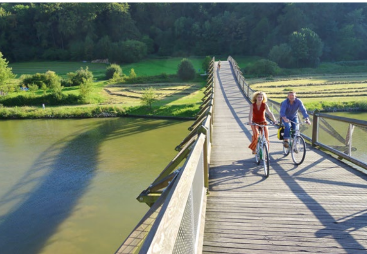
Das Altmühltal eignet sich für ausgiebige Radtouren