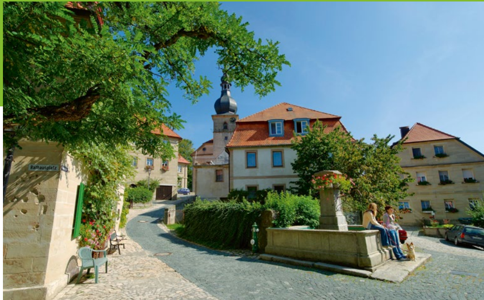
Historischer Obermarkt in Weidenberg

um in Neuenmarkt (größtes Spezialmuseum Deutschlands)