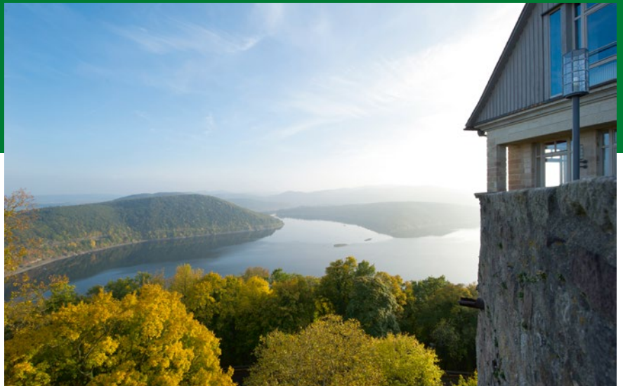
Zahlreiche Freizeit- und Outdoor-Möglichkeiten bietet Nordhessen, die Heimat der Brüder Grimm