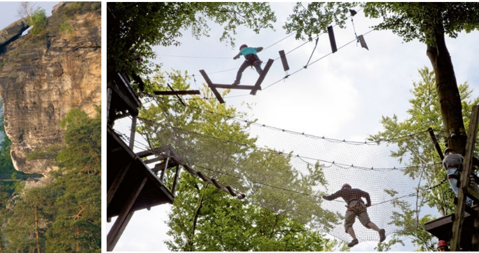
Ob Gruppen, Vereine oder Unternehmen – im Klettergarten kommen alle auf ihre Kosten

Vollkuppelshow bis zum Weltraumflug. Ein virtuelles Abenteuer auf 230 Quadratmetern „gewölbter Leinwand“. Vielfältige Veranstaltungen wie das Gartenbahntreffen im April (29./30.) und September (23./24.) oder die „Miniwelt bei