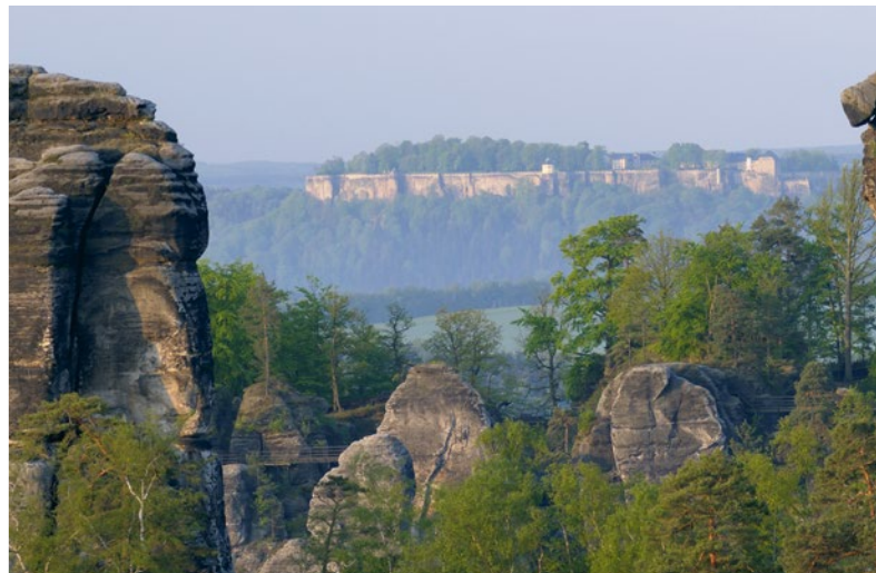
1.106 frei stehende Sandsteingipfel zählt der Nationalpark Sächsische Schweiz

tur, die mit Spitzenköchen und Veranstaltungen wie der „Bliesgauer Lammwoche“ zur besten im gesamten deutsch-französischen Sprachraum gehört.