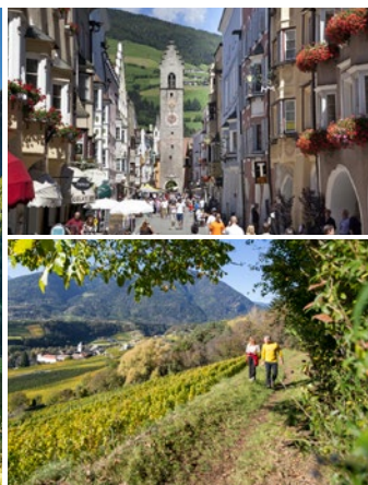
Ansprechende Mischung: beeindruckende Natur und historische Städte im Eisacktal

D as Eisacktal in Südtirol schlängelt sich vom Brennerpass in Richtung Bozen und verbindet den alpinen Norden mit dem mediterranen Süden. Seine abwechslungsreiche Natur- und Kulturlandschaft bietet eine Vielfalt an Urlaubserlebnissen für Gruppenreisen: Beeindruckende Berggipfel umrahmen die Alpinstadt Sterzing und das Dolomital Villnöss, während die historischen Städte Brixen und Klausen von Weinhängen und