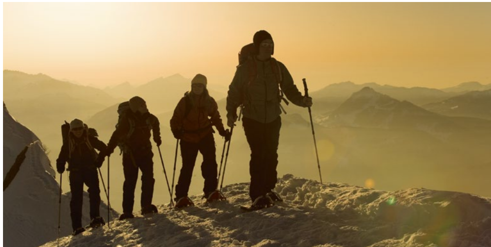
Schneeschuhwandern in den Alpen – die Region ist ein Hotspot für Outdoor-Fans

Orchideenland und Savoir-vivre. Das UNESCO-Biosphärenreservat Bliesgau verzaubert mit Orchideenwiesen, Buchenwäldern, seltenen Tierarten und einer eindrucksvollen Auenlandschaft. Per Bike, E-Bike, zu Fuß oder mit der Pferdekutsche kommen Besucher hier auf Touren. Das UNESCO-Biosphärenreservat Bliesgau liegt in der südöstlichsten Ecke des Saarlands an der Grenze zu Frankreich und wird wegen seiner sanft hügeligen Landschaft als saarländische