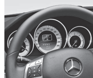
Display im Kombiinstrument