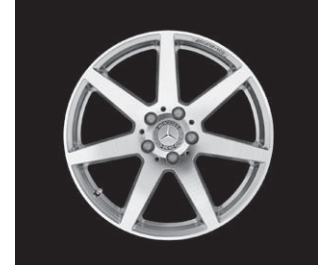
AMG 7-Speichen-Design (782)