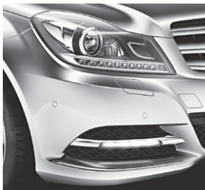
Intelligent Light System mit LED-Tagfahrleuchte