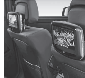
Fond Entertainment System, Kit