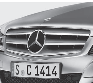
Lamellenkühler mit Stern