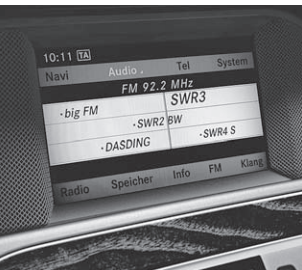
Audio 20 CD