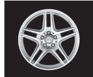
AMG 5-Doppelspei.-Design (786)