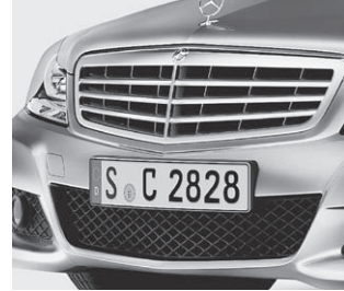
Lufteinlass mit Rautengitter

Zentralverriegelung mit Innenschalter und Crash-Sensor