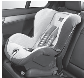
Kindersitz DUO plus