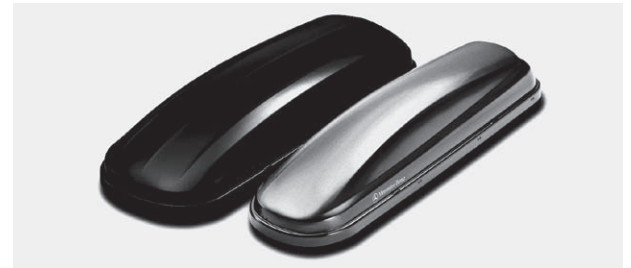
Mercedes-Benz Dachboxen 450 und 330