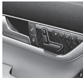
Vordersitz links mit Memory-Paket