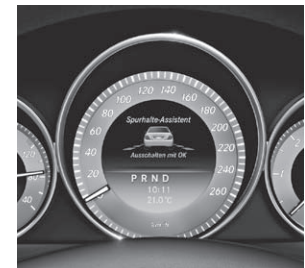
Fahrerassistenz-Paket PLUS, u. a. mit aktivem Totwinkel-Assistent