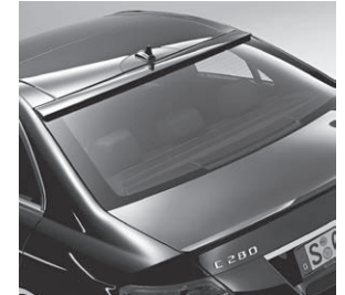
Dach- und Heckspoiler