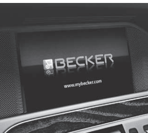
Becker® MAP PILOT