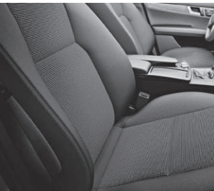
Polsterung Stoff »Brighton«