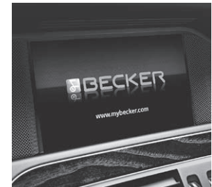
Becker® MAP PILOT