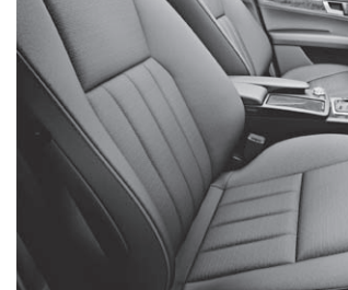
Polsterung Stoff »Newcastle«