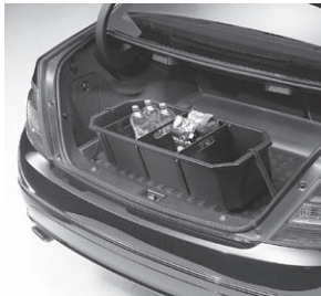
Kofferraumwanne, flach mit Staubbox