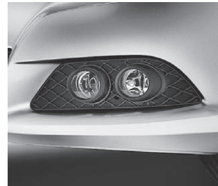
Tagfahrlicht und Nebelscheinwerfer