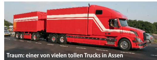
Traum: einer von vielen tollen Trucks in Assen