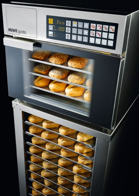
Der Miwe Gusto ist vor allem für klassische Backwaren geeignet.