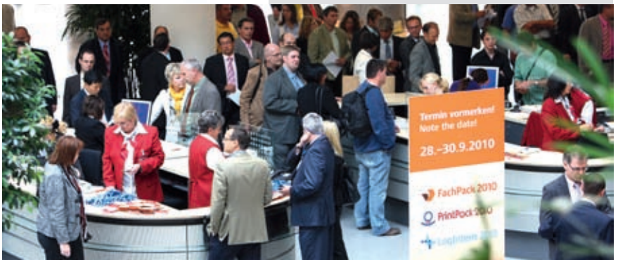
Die Nürnberger Messe rechnet wie im Vorjahr mit etwa 33.000 Besuchern.

Fördersysteme, Lager- und Kommissioniersysteme, Verladesysteme, Lade-, Transport- und Lagerhilfsmittel, Steuerungssysteme und Software für den Materialfluss, Identifikations-, Codier- und Warensicherungssysteme, Dienstleistungen für innerbetriebliche Logistik