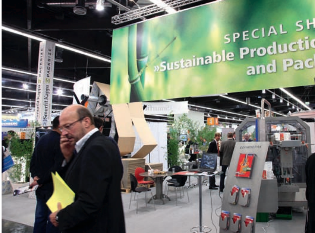
Die Sonderschau Nachhaltigkeit stellt die Reduzierung von Packstoffen in den Mittelpunkt.