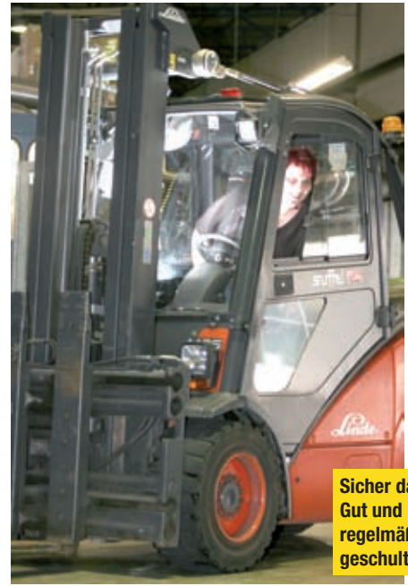
Sicher dabei: Gut und regelmäßig geschult.

wendige Ausbildung in einem Ausbildungsplan erfasst wird. „Learning bei doing“ darf es im Zusammenhang mit sicherheitsrelevanten Grundlagen nicht geben, sondern „Learning before doing“. Das kann auch in Form einer praktischen Ausbildung erfolgen.