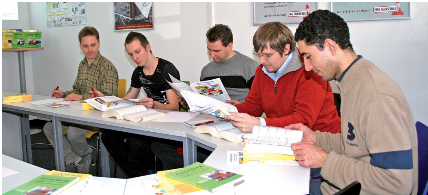
In Gefahrgutschulungen sollten die Schnittstellen zwischen den Beteiligten in der Transportkette besonders herausgearbeitet werden.

PLANSPIELE Wer alle Beteiligten von Gefahrguttransporten in einem Unternehmen schult, sollte konkrete Aufgaben in Partnerarbeit lösen lassen. Ein Vorschlag.