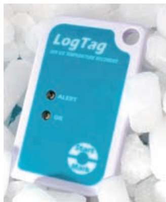
LEDs zeigen an, ob die Messwerte innerhalb der Grenzwerte liegen.

Über Interface und LogTag-Analyzer-Software, die als Gratis-Download zur Verfügung steht, können die einzelnen Parame-