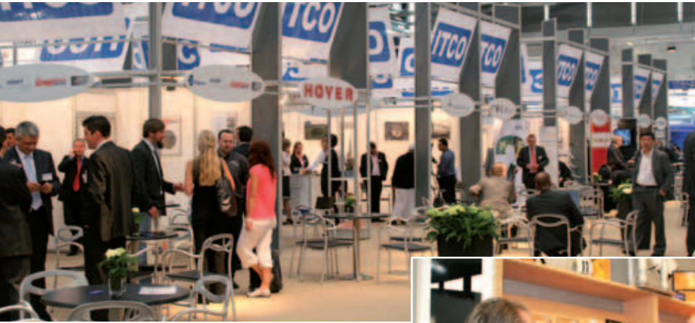
Tankcontainerbranche vereint im ITCO-Village.

NACHBERICHT Die Weltleitmesse rund um die Themen Transport und Logistik wartete in diesem Jahr mit einem sehr breiten Spektrum an Systemen und Dienstleistungen auf. Impressionen eines Messerundgangs.