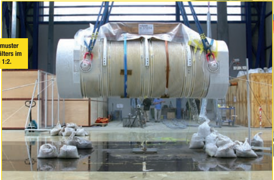
Das Prüfmuster des Behälters im Maßstab 1:2.

B und stoppt Castor-Transport“ lautete die Schlagzeile der Süddeutschen Zeitung vom 29. April 2008. Hintergrund war die Empfehlung einer deutsch-französischen Regierungskommission, den für 2009 geplanten Atom-müll-Transport von der Wiederaufbereitungsanlage bei La Hague/F in das deutsche Zwischenlager Gorleben wegen der Verzögerung der Genehmigungen zu verschieben. In dem Artikel wurden auch die Kritikpunkte der BAM Bundesanstalt für Materialforschung und -prüfung an den noch fertig zu stellenden Sicherheitsnachweisen im verkehrsrechtlichen Zulassungsverfahren ausbreitet.