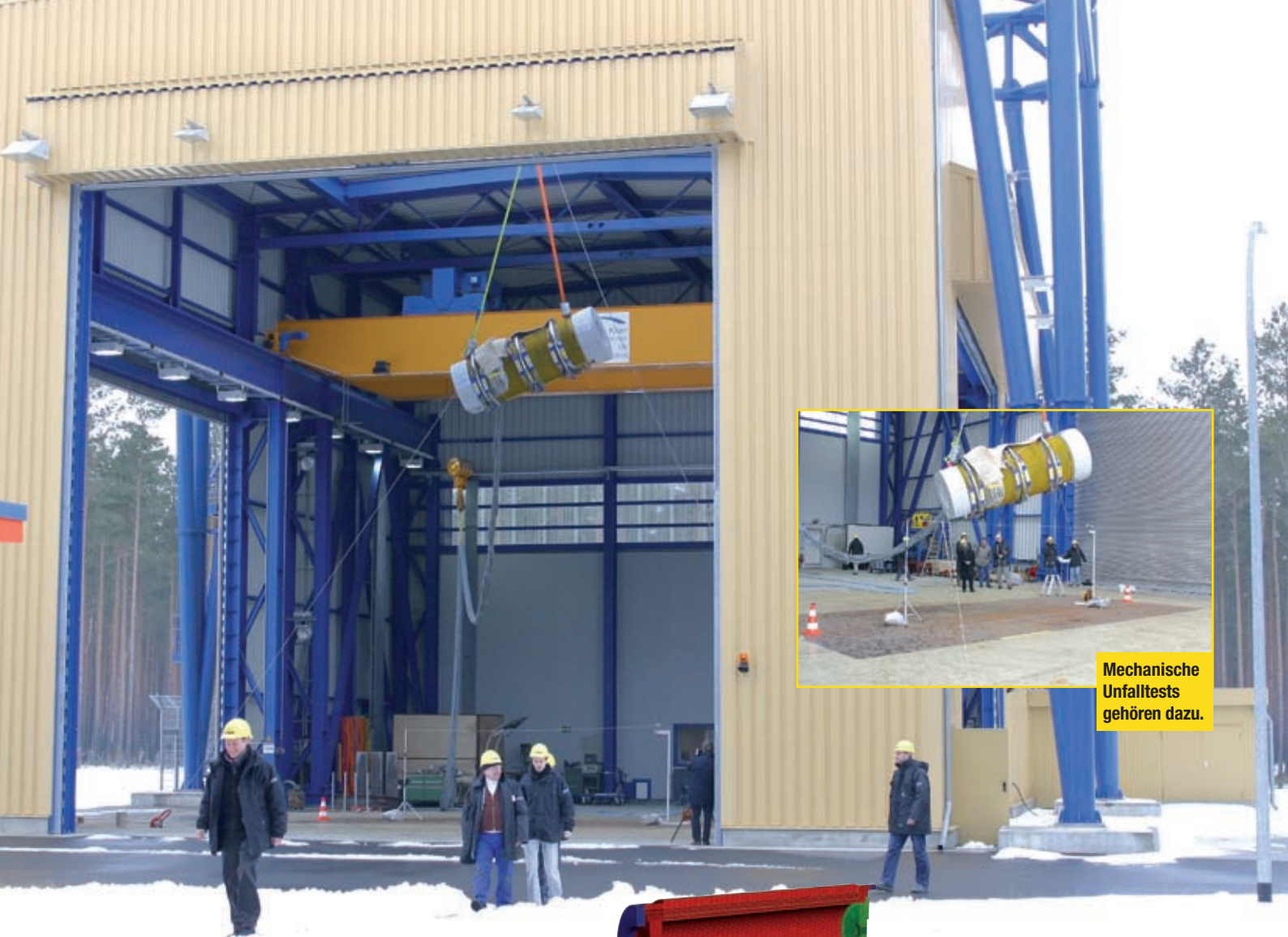
Mechanische Unfalltests gehören dazu.