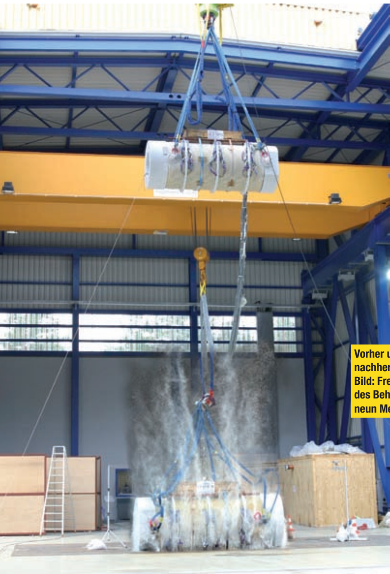
Vorher und nachher in einem Bild: Freier Fall des Behälters aus neun Meter Höhe.

dige Bundesbehörde für die Bauartprüfung dieser Verpackungen. Die der BAM vom Bundesministerium für Verkehr, Bau und Stadtentwicklung zugewiesenen Aufgaben beinhalten die sicherheitstechnischen Prüfungen der mechanischen und thermischen Designauslegung, des dichten Einschlusses sowie die Genehmigung von qualitätssichernden Maßnahmen für die Herstellung, den Betrieb und die Wartung.