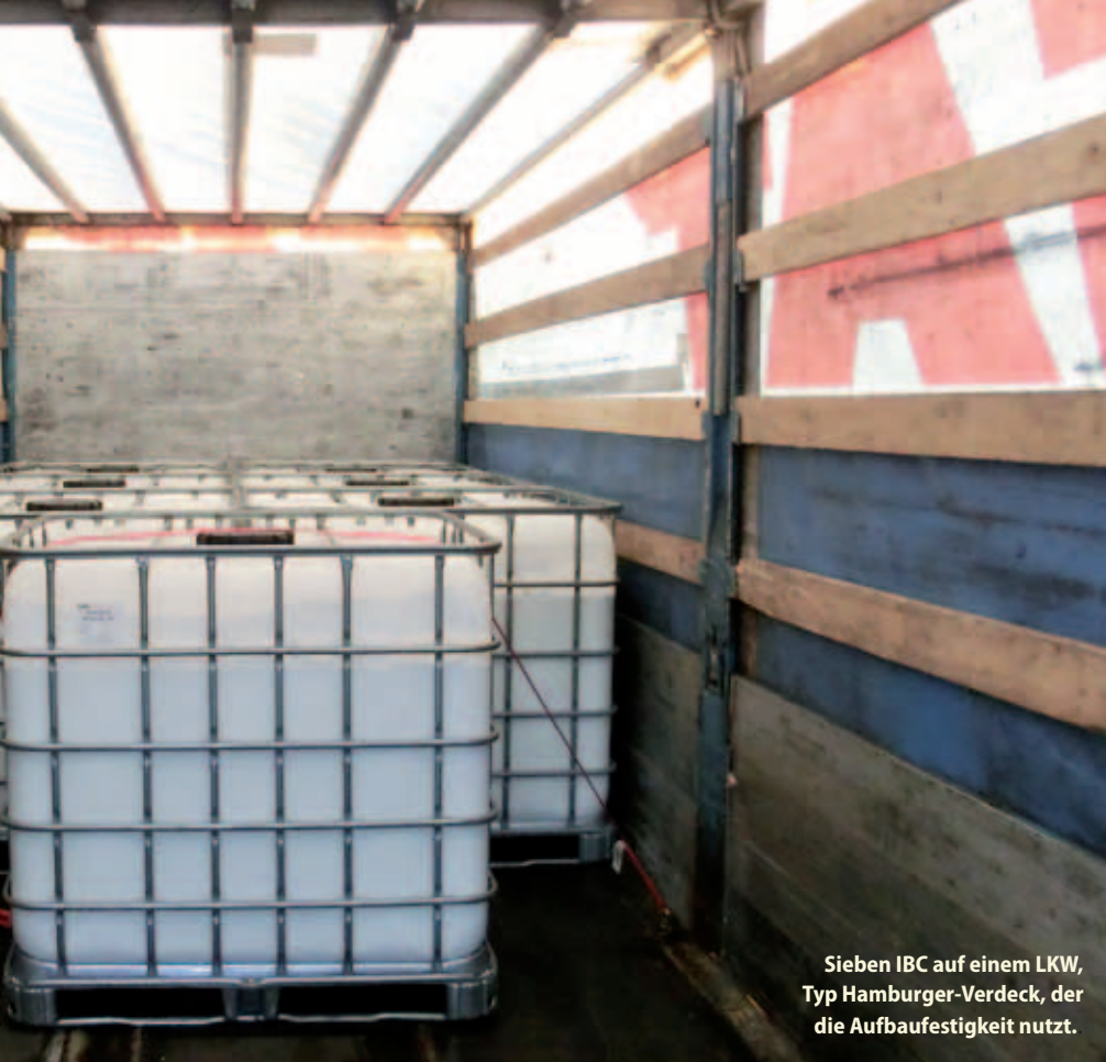
Sieben IBC auf einem LKW, Typ Hamburger-Verdeck, der die Aufbaufestigkeit nutzt.

minus Stirnwand = 6.160 daN – 1.540 daN – 4.800 daN = – 180 daN. Stirnwand und Reibkraft übersteigen die Sicherungskraft der Ladung.