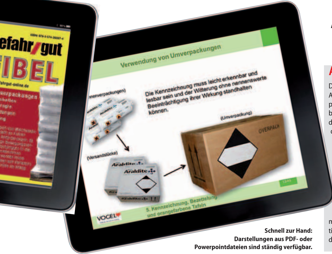
Schnell zur Hand: Darstellungen aus PDF- oder Powerpointdateien sind ständig verfügbar.