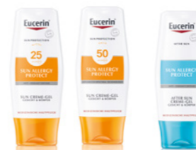
*SUN LOTION EXTRA LIGHT, FACE SUN CREME

SUN ALLERGY PROTECT Schutz bei sonnenallergiegefährdeter Haut